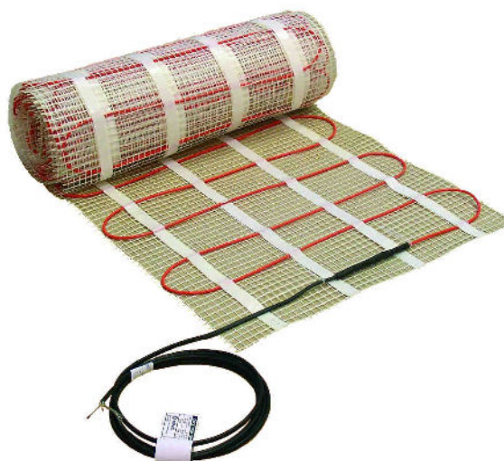
TABELA DOBORU – LDTS 160W/m 2